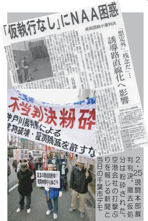
2・25 現闘本部裁判判決。撤去仮処分は粉碎された。空港会社の打撃ぶりを報じる新聞と当日の千葉市デモ