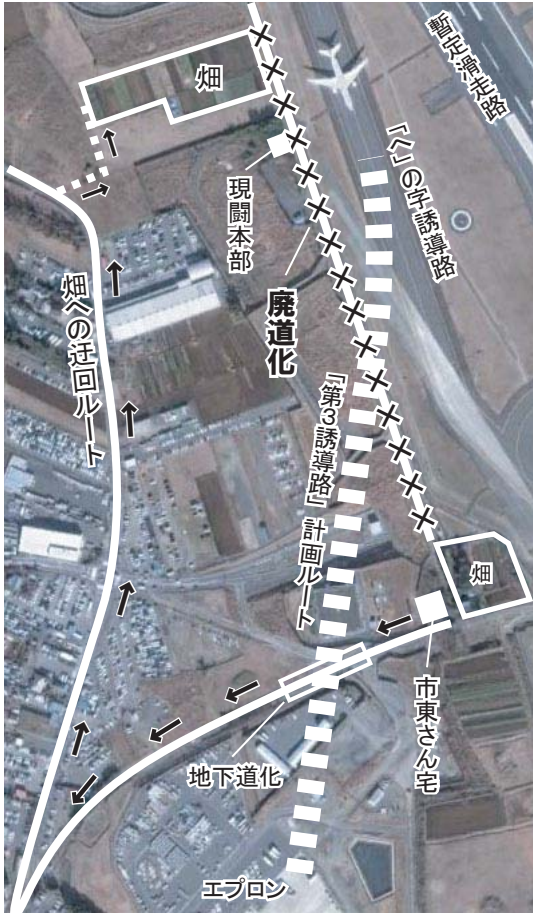
* 図の「第3誘導路」が新誘導路計画です

反対同盟は、現闘本部建物撤去の強制執行を止めました（左に記事と写真）。正義は必ず勝利します。