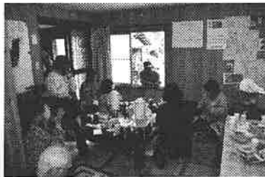
4月16日の天神峰カフェ