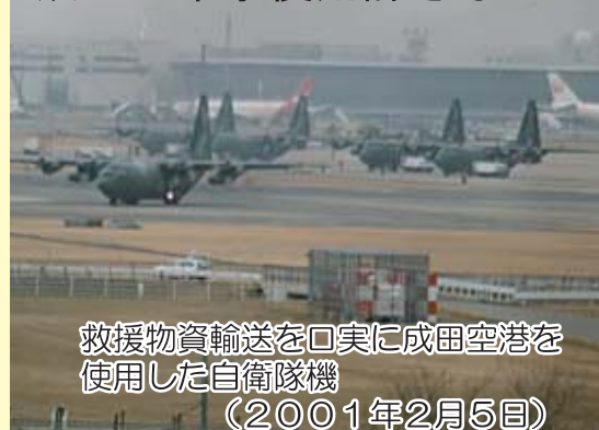
救援物資輸送を口実に成田空港を使用した自衛隊機 (2001年2月5日)