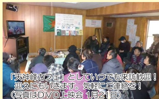
「天神峰カフェ」としていつでも来訪歓迎！ 迎えにもいきます。気軽にご連絡を！ (写真はDVD上映会 1月21日)

闘う仲間が毎日集い、全国各地から駆けつけてくれる皆さんと、がっちりスクラムを組んでいます。