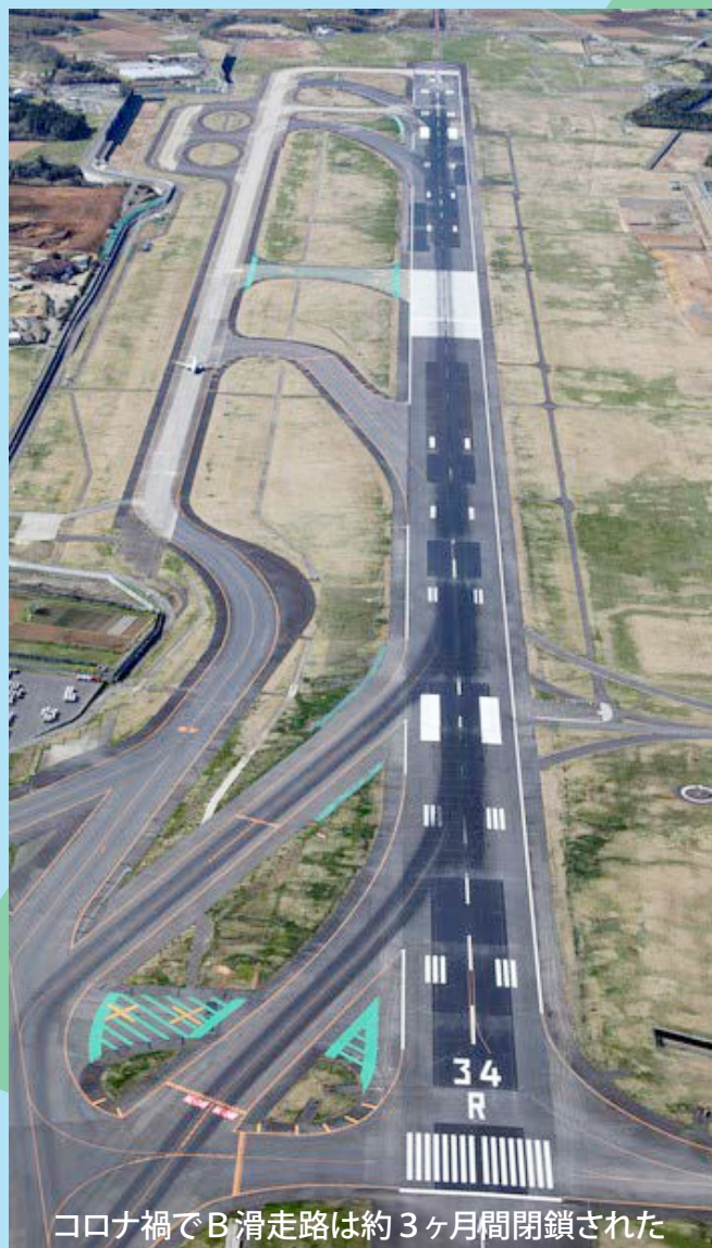
コロナ禍でB滑走路は約3ヶ月間閉鎖された

米国のBLM運動や香港、韓国での闘いなど、世界中で歴史を画する闘いが始まっています。日本でも