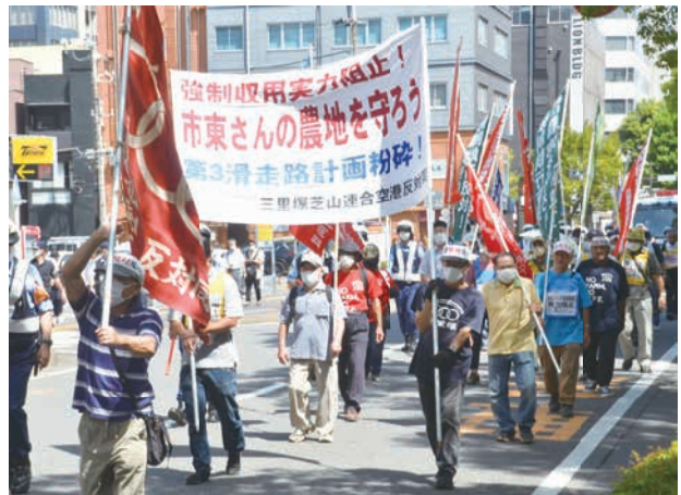
千葉地裁に向け市街地をデモ行進(7月24日)

家が耕し続けてきたところであり「不法耕作」なんて言われる筋合いは一切ありません。