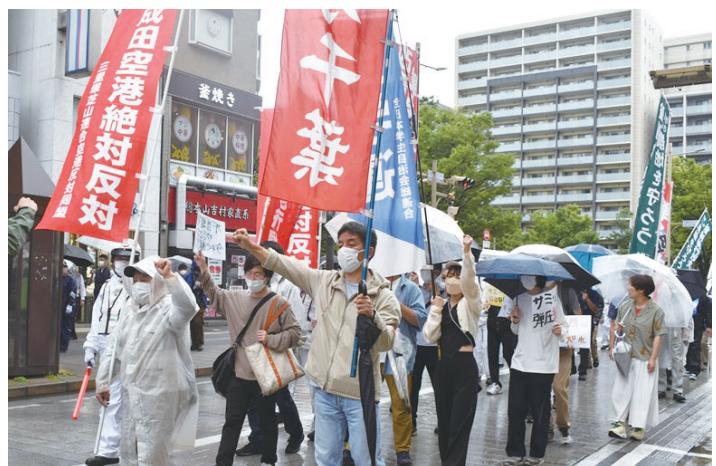
不当逮捕された6人の仲間への勾留理由開示公判に先立ち千葉地裁に向けてデモ行進 (5月29日)

この勝利をバネに、被爆地ヒロシマの思いをねじ曲げ改憲・戦争に突き進む岸田政権を倒しましょう!