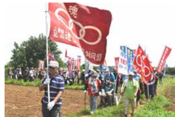
南台農地からのデモ (7月7日)

しかし、岸田政権とNAAは私たちの闘いをつぶすために、どんな無理を通して農地を奪おうとたくらんでいます。